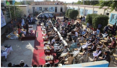
تاریخچه پوهنتون مولانا جلال الدین محمد بلخی